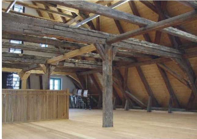
▲ Der historische Veranstaltungsraum

Seit 2008 dient es der Öffentlichkeit als Informations-, Ausstellungs- und Veranstaltungszentrum. Der Besucher findet hier neben der geschichtlichen Entwicklung des Hauses auch Informationen zu wechselnden Ausstellungen.