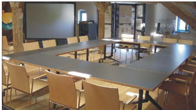
▲ Bestuhlungsmöglichkeit für Veranstaltungen

Das Dachgeschoss mit dem historischen Dachstuhl steht für kulturelle Veranstaltungen und Tagungen bis zu 70 Personen zur Verfügung. Über audiovisuelle Medien werden Filme und Vorträge, sowie die kostenlose Nutzung des Internet bereitgestellt. Detaillierte Informationen zu den aktuellen Ausstellungen sind im Internet unter www.schiffmeisterhaus.de abrufbar.