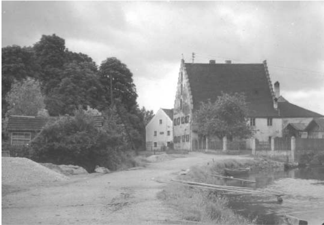
▲ Das Schiffmeisterhaus um 1920

Das denkmalgeschützte Schiffmeisterhaus ist eines der ältesten Bürgerhäuser Deggendorfs. Die Bausubstanz des Gebäudes reicht bis in das Mittelalter. Seine heutige Gestalt erhielt es im 18. Jahrhundert.