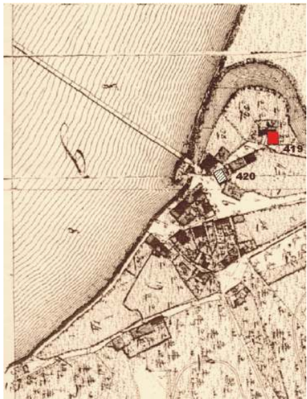
▲ Lage des Schiffmeisterhauses um 1828

Das Schiffmeisterhaus Deggendorf war ein Verkehrsknotenpunkt für die Donauschifffahrt. Von 1643 bis 1851 waren hier nachweislich Schiffmeister ansässig, die den Gütertransport auf der Donau organisierten. In dieser Zeit wurde in den Speicherräumen des Schiffmeisterhauses hauptsächlich Salz und Getreide gelagert.